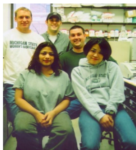
短期留学先研究室のメンバー