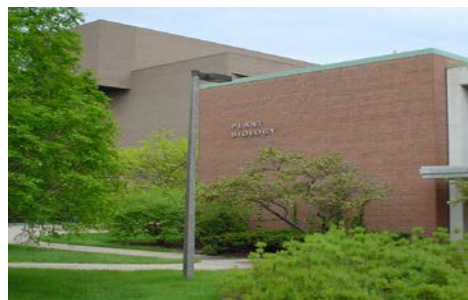
全米屈指の植物研究施設