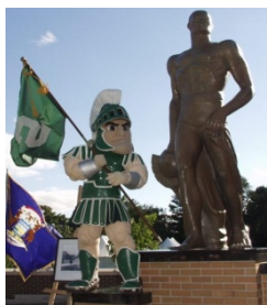
大学のマスコットのスパルタン

1855年に農学関連分野を中心に、全米初のResearch-Intensive Land-Grant Universityの一つとして創立された。ミシガン州イーストラシング市（人口約5万人、デトロイト・シカゴから空路約1時間）に21km 2 のキャンパスを持っている。農学および自然科学部、獣医学部、経済・経営学部、工学部、医学部等の合計17の学部（College）からなり、130カ国から留学生を受け入れている。