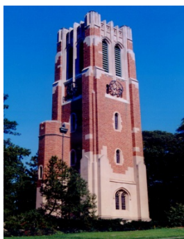
大学シンボルの時計台