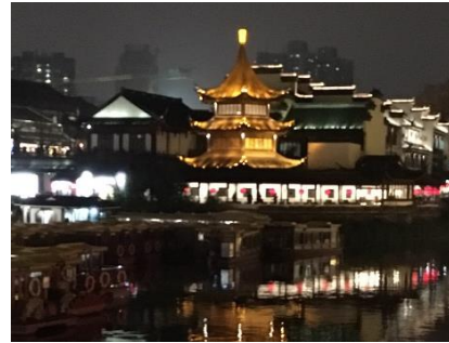
南京夫子廟の夜景