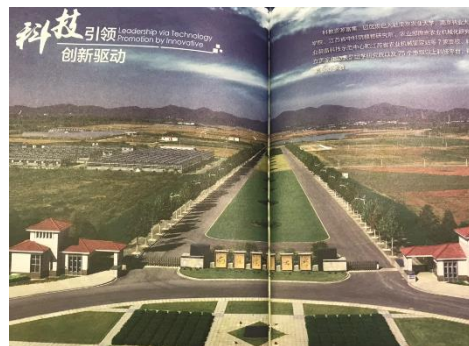
白馬キャンパスは国家農業技術開発の中心地にある

中国農薬部に所属する重点大学で、中国で最も古い有名な農業大学のひとつ。メインキャンパスは南京市郊外の景勝地に位置し、校地面積9km 2 、校舎敷地面積72万m 2 、図書館蔵書206万冊を有している。農学を主体に、工学・理学・経済学・文学といった教育研究分野も拡充されつつある。本学農学部との間で、学生の受入・派遣による交流が進んでいる。