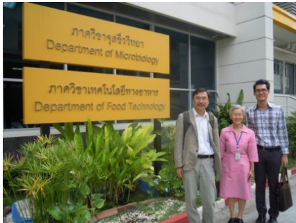
理学部食品工学科の新設棟

●学部学生 約25,000人 ●大学院生 約12,000人 ●教職員 約8,100人 ホームページ http://www.chula.ac.th 交流協定締結年月日：2010年2月1日 主管学部：農学部