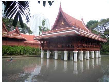
構内の伝統的な建築物