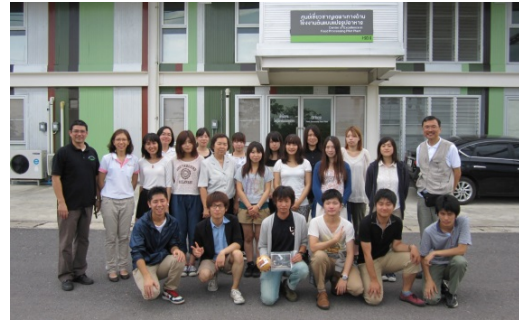
郊外サラブリでの加工実習施設風景