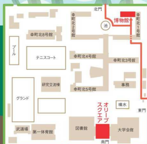
▲香川大学幸町北キャンパス

※駐車場がありませんので、公共交通機関もしくは周辺のコインパーキングをご利用下さい。