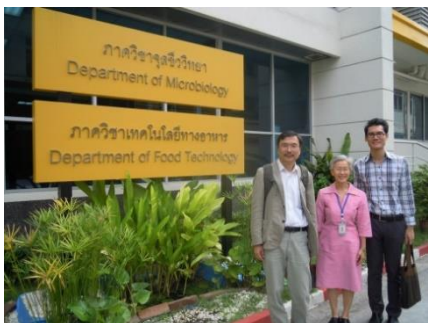
理学部食品工学科の新設棟