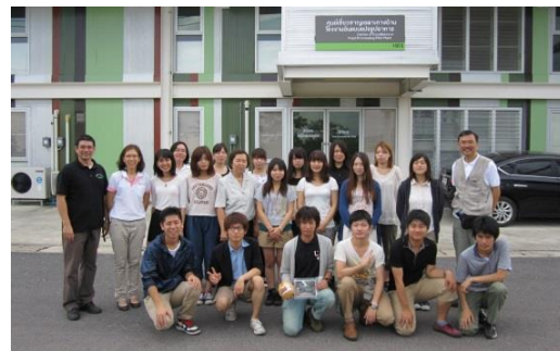
郊外サラブリでの加工実習施設風景