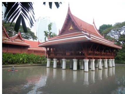
構内の伝統的な建築物