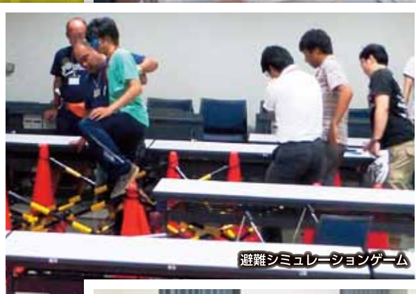
避難シミュレーションゲーム