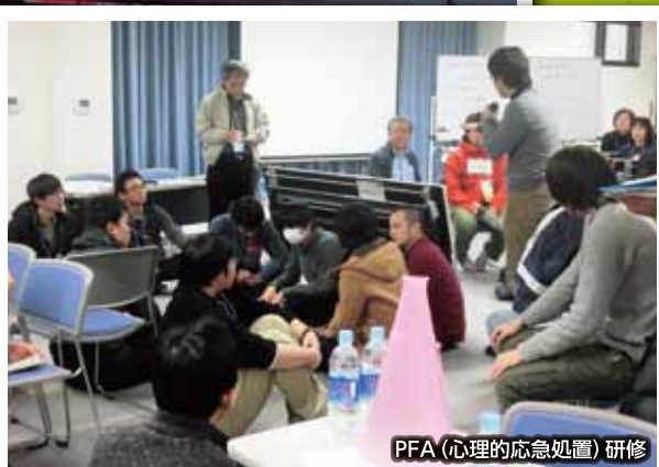
PFA(心理的応急処置)研修