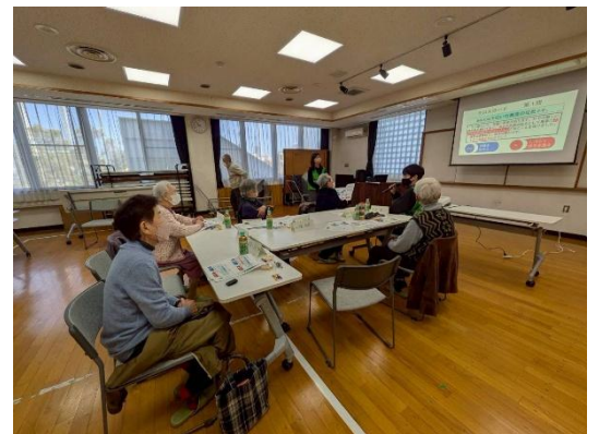
(絵手紙プロジェクトの様子)

絵手紙プロジェクトは、地域の高齢者の方と絵手紙を通じて交流を広げることを目的に活動しています。絵手紙プロジェクトでの交流を通じて、防災活動への参加につなげていきたいと考えています。絵手紙プロジェクトでは、二番丁地区と亀阜地区で活動をしています。それぞれの地区において、亀阜地区では5名、二番丁地区では6名の高齢者の方々と絵手紙を通じて交流を行っています。活動内容としては、毎月1回ほどのペースで絵手紙のやり取りを行っています。また、今年度は、7月と2月に亀阜地区で、また2月に二番丁地区で対面交流会を実施しました。