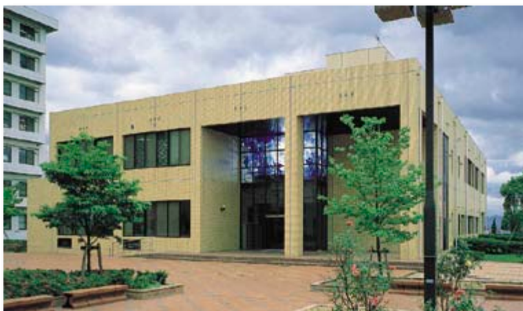
医学部分館 Faculty of Medicine Branch