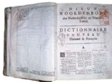
ハルマ『蘭仏辞典』第二版 Dutch-French Dictionary