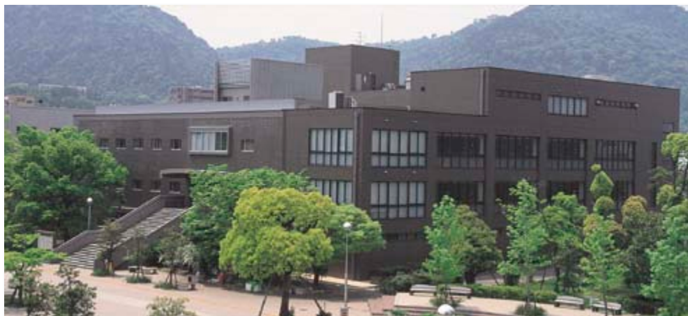
附属図書館 University Library