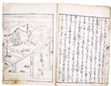
『嵐者無常物語』下巻 Arashiwamujomonogatari