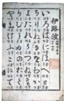
朝鮮版 伊路波 Iroha