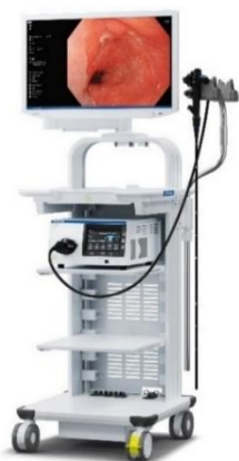
内視鏡システム「EVIS X1」 (システムセット例)

「EVIS X1」は、オリンパス独自の技術の搭載に加え、従来機である「EVIS LUCERA ELITE」と「EVIS EXERA III」の、それぞれ異なるスコープラインアップとの互換性も確保しています。これにより幅広いラインアップのスコープをお使いいただけ、内視鏡による診断・治療の可能性拡大に貢献します。