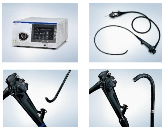
(左上) EVIS X1 ビデオシステムセンター OLYMPUS CV-1500 (右上) 上部消化管汎用ビデオスコープ OLYMPUS GIF-EZ1500 (左下) 上部消化管汎用ビデオスコープ OLYMPUS GIF-XZ1200 (右下) 大腸汎用ビデオスコープ OLYMPUS CF-XZ1200 シリーズ