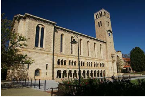
西オーストラリア大学の象徴