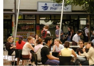
キャンパスの風景