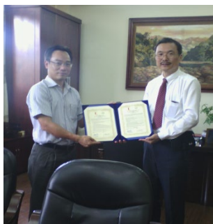
学長から協定書の受理