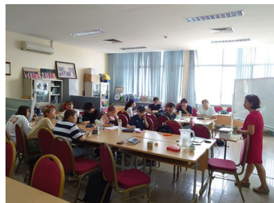
農学部生が英語で授業を受けている様子