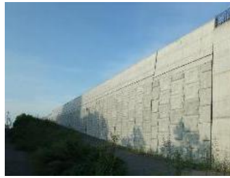
土でつくられた社会基盤構造物の例（補強土壁）

土は我々が生活する地盤を構成しているのみならず、古くから様々な構造物の材料として利用されてきました。現代社会においても、様々な技術・知見を取り入れながら、数多くの社会基盤構造物が土でつくられています。本講義では、土でつくられた社会基盤構造物を対象として、その種類や役割、用いられている技術について、安定や変形といった力学的性能を踏まえながら学びます。