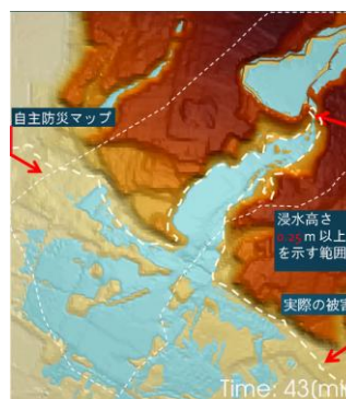
2017年九州北部豪雨時の朝倉地域の氾濫状況と解析の比較

「将来、何が起こって、その際、何がどのようになるのか？」と問われた場合、それに対する正解はないかもしれませんが、おおよその予測は可能です。それを実現するのがコンピュータを用いた数値シミュレーションです。コンピュータの発達とともに、現在では、多数の建物を含む都市全体の地震動解析、津波、高潮、ため池の決壊等による都市全体の浸水解析、災害時における住民の都市内避難行動解析などが可能となっています。本講義では、都市の「安全度診断」に一翼を担う数値シミュレーションの世界を紹介します。