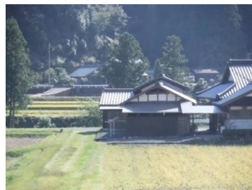
文化的景観（松野町）

近年の歴史的建造物に関わる動きとして、建造物単体だけではなく、歴史的な町並み景観や、文化的な集落景観の視点から、まちづくりとして保存活用を目指す動きが活発化しています。四国で注目されている魅力的な建造物や景観の事例をご紹介します。