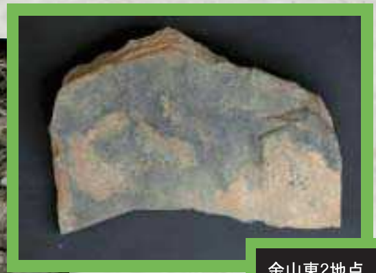
金山東2地点 板状石核 厚3.82cm