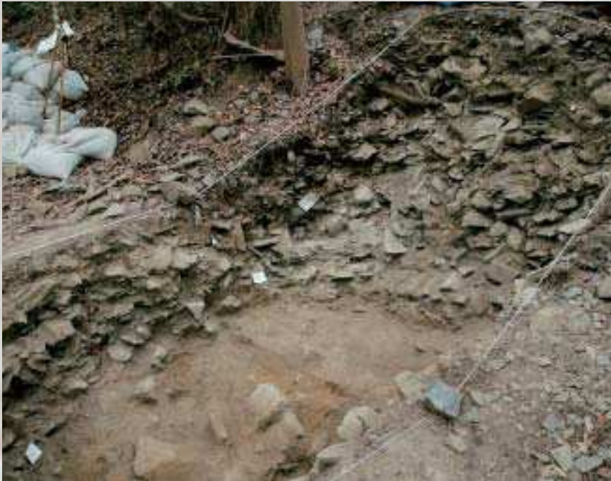
金山東2地点の発掘調査 2008年8月