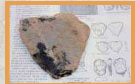
広島県帝釈・観音洞 板状石核 厚2.7cm