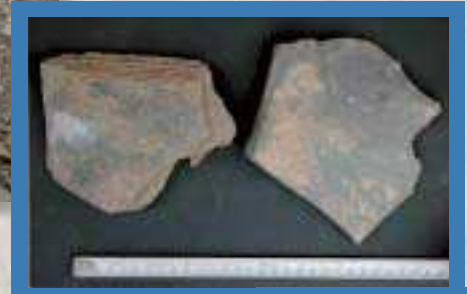
金山東2地点 板状石核 厚2.45 厚2.6cm