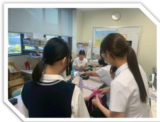
△高校生との実技演習