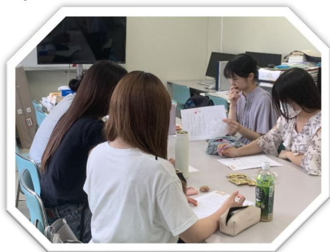
△初回ミーティング

そこで本活動では、「話しにきーまい、ふれあいプロジェクト」として、三木町のさんさん館みきにおいて、バイタルサイン測定や体操、交流会を通して健康づくりと対話の場を提供した。