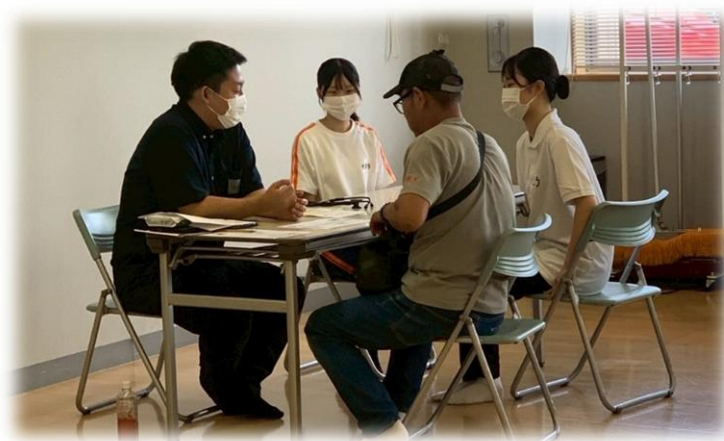
△ふれあい交流会実施