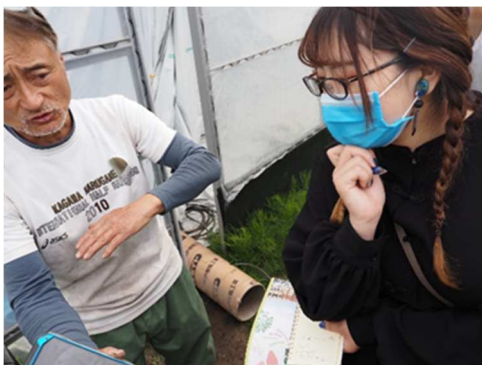
左 :インタビューの様子 中央:アスパラーズ紹介文 右 :6体のアスパラーズ

KaNoHa projectは農家さんと大学生が関わり合うきっかけを作る事で香川大学生にとって農業を身近な存在にすること、香川県内での地産地消の促進を目標に活動を行なっている。現在行っていることとして①香川大学生が農作業を1から行う畑の運営、②農家さん訪問とインタビュー、農作業手伝い③Instagramでの情報発信(フォロワー1200人以上、InstagramID: project_kanoha)の3つが挙げられる。