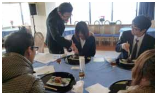
ビジネスマナー講座の様子