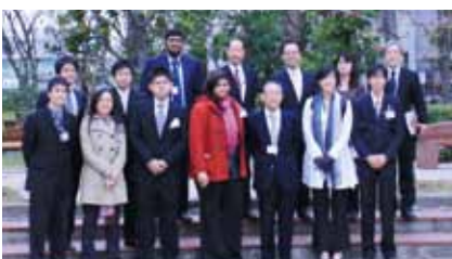
ブルネイ・ダルサラーム大学による表敬訪問