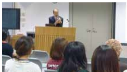
本学の留学支援制度について説明する ロン留学生センター長