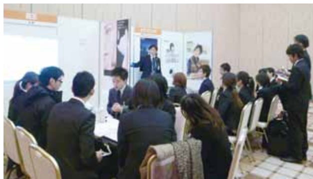
個別企業相談ブースの様子

このツアーは本学の留学生に対して、就職に関する情報収集や必要なスキルを習得するための機会を与え、留学生がより希望に沿った就職ができるよう支援するために行ったもので、日本での就職に興味がある留学生18名が参加しました。