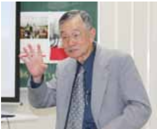
国際交流研究会の様子