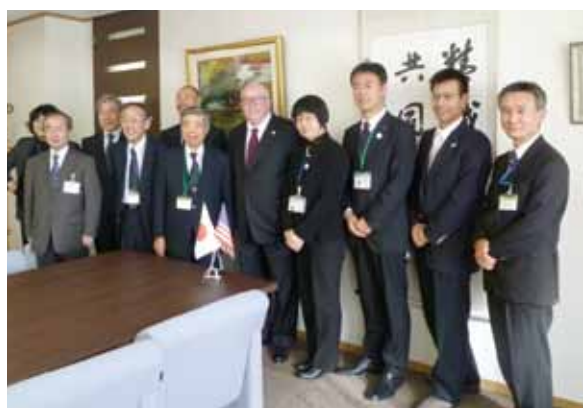
学長表敬訪問の様子