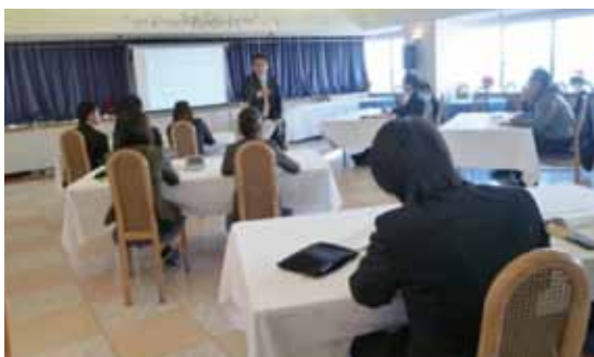
就職セミナーの様子

留学生は、慣れないビジネスマナーに四苦八苦しながらも懸命に取り組み、様々な情報や技術を習得できる、有意義なセミナー & 講座となりました。(国際グループ 浅野 文恵)