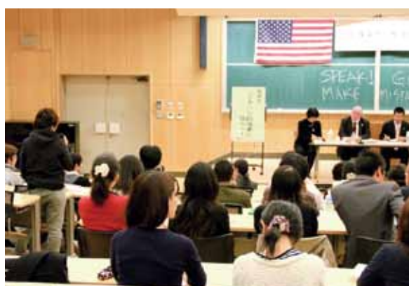
懇談会にて質問する学生