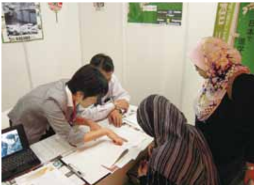
本学ブースでの相談