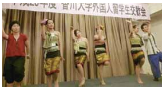
タイの民族舞踊(Zeang Pong Lang)