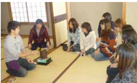
茶道部(石州流)の協力による茶道体験