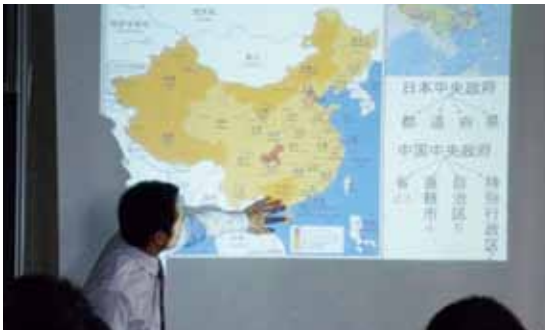
中国の行政区分について説明する留学生