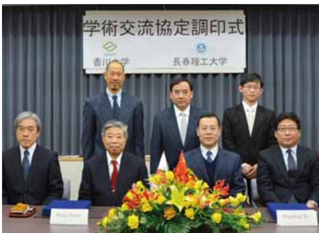
長春理工大学との調印式