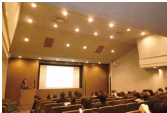
就活オリエンテーション会場の様子