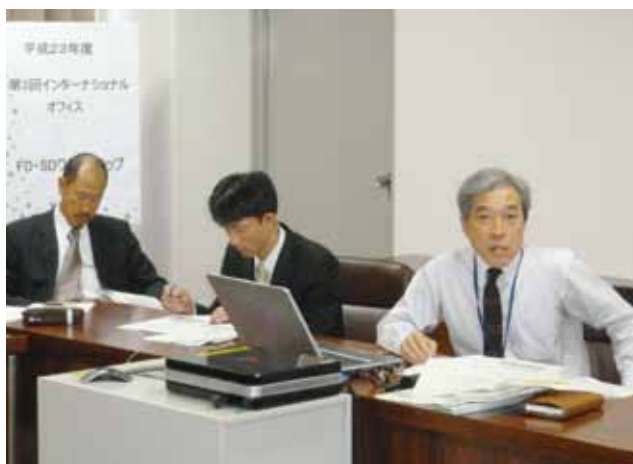
飯田インターナショナル副オフィス長による発表の様子