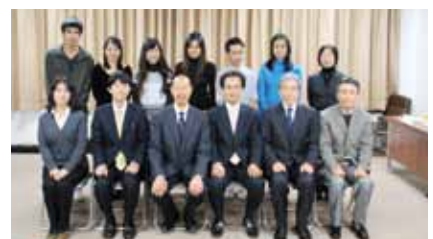
チェンマイ大学による表敬訪問