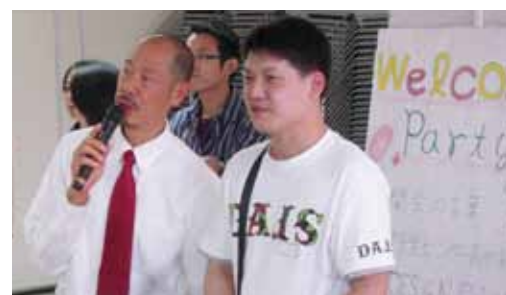
留学生へのインタビュー

上記のガイダンスが終了した後、留学生、チューターに加え、地域の皆様や関連する教職員も参加して、歓迎の情報交換会を行い、留学生たちは以後の本学での学習・研究へ向けて、抱負などを語ってくれました。