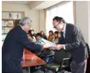
表敬訪問(チェンマイ大学)