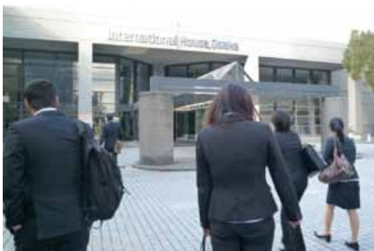
会場に向かう留学生たち