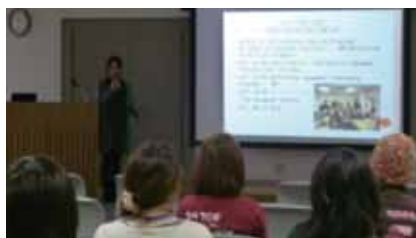
カナダ留学の体験談を発表する学生