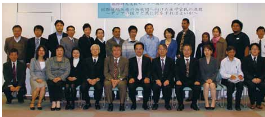
講演者、コメンテーター、海外からの参加者など

国際ワークショップ「国際遠隔医療の新展開へ向けた産学官民の連携～アジアの国々と共に何をすればよいか～」(インターナショナルオフィス国際研究支援センター主催、日本遠隔医療学会・香川県医師会・ヘルスケア・イノベーション・フォーラム(HCIF)後援)が11月18日(金)、幸町キャンパス研究交流棟研究者交流スペースで開催されました。ワークショップには、海外からの参加者15名をはじめ、本学の教職員・学生、学外参加者の計53名が参加しました。日本国内における遠隔医療の現状や、日本の遠隔医療の関係者が国際展開を試みている様子が詳細に説明されたほか、国際遠隔医療を今後さらに発展させるためにはいかなる課題と可能性があるかについて、参加者を交えて、国際比較を含めた多様な意見交換が行われました。