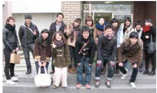
開講式前日にBuddies学生と

第15回から始めた研修生支援の「Buddies」制度に、今回は本学学生11名が登録してくれ、期間中さまざまな交流活動が行われたのも、双方にとって有意義だったことと思います。また、最終日のさよならパーティーで、Buddiesから研修生1人1人に心のこもった色紙がサプライズで贈られたのも、大変印象深く、心温まる一幕でした。