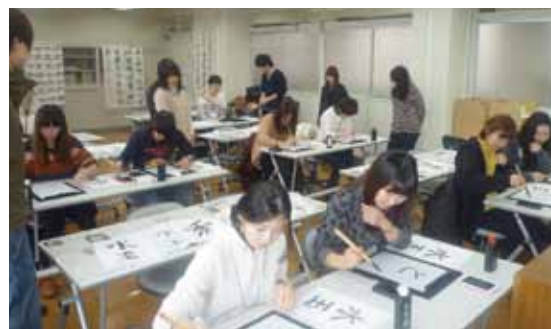
書道部の協力による書道体験