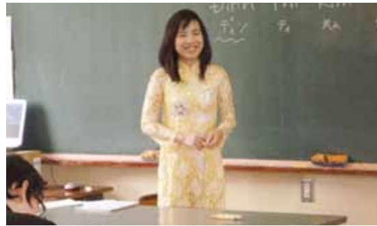
ベトナムの民族衣装(アオザイ)を着て自己紹介する留学生