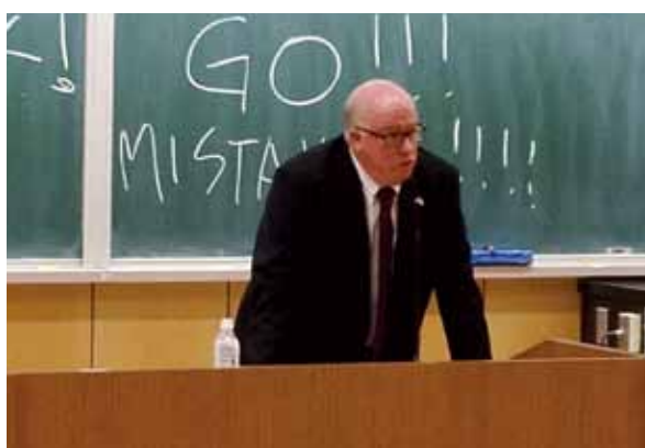
講演中のリネハン総領事