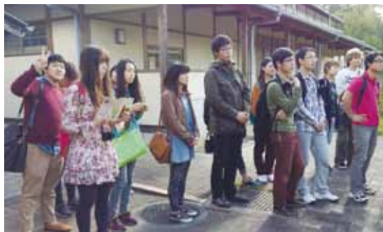
まんのう公園自然生態園にて