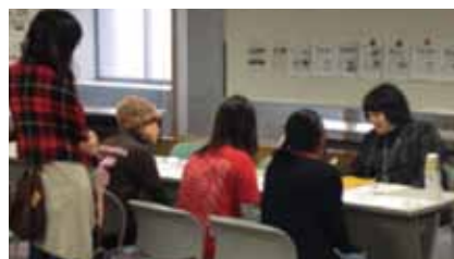
教育学部ブースで個別説明を受ける学生