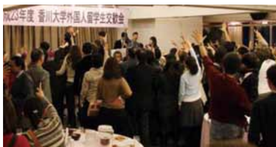
学長とじゃんけん