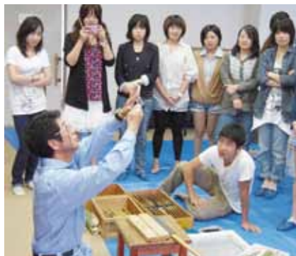
竹細工作成中の本学学生

第1回 平成23年9月28日(水)から29日(木)にかけて、第1回外国人留学生課外教育行事を行いました。まず、愛媛県のタオル美術館、伯方の塩工場の2ヶ所を見学した後、広島県福山市の自然研修センターに宿泊しました。2日目は同施設において竹細工の体験を行った後、JFEスチール西日本製鉄所を見学しました。今回は全く異なる分野の2種類の企業見学ができ、日本文化の体験も行うことができました。