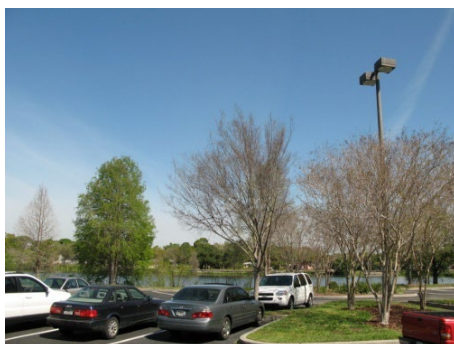
キャンパス内の様子

セントピーターズバーグ大学は、高松市の姉妹都市の1つである、アメリカ合衆国フロリダ州セントピーターズバーグ市に立地する公立大学である。1927年に私立の短期大学として設立されたが、1948年に公立化され、2001年に4年制大学となった。現在、セントピーターズバーグ市内を中心に8つのキャンパスをもち、4万6千人に近い学生を擁する、地域を代表する高等教育機関の1つとなっている。今後、高松市とセントピーターズバーグ市との長きにわたる交流を基礎に、両大学間で教育研究分野における活発な交流活動が図られることが期待されている。