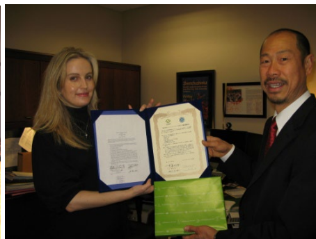
学術交流協定の締結