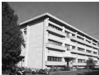
課外活動共用施設