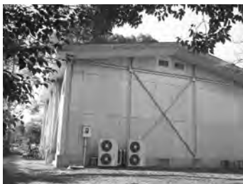
音楽系サークル共用練習室