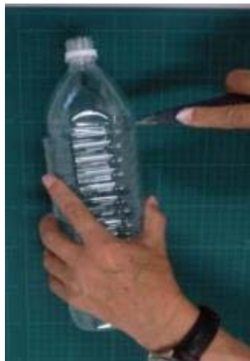
カッターナイフで切る