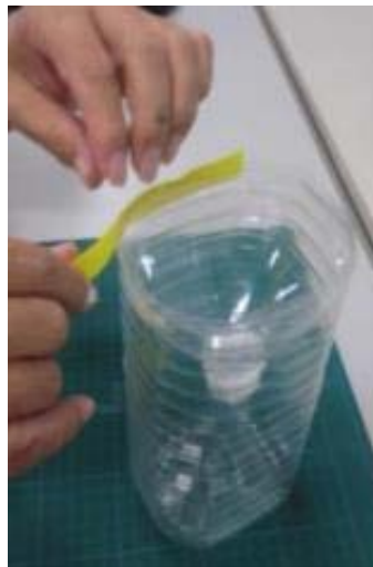
テープで巻いて固定