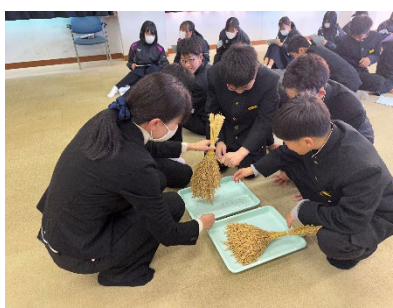
野生種と品種改良した稲穂を比較する生徒の様子