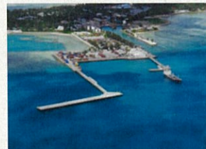
ベジオ港拡張：連絡橋、係留棧橋(キリバス)