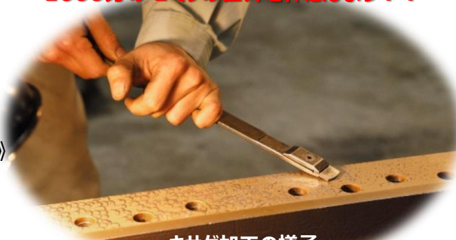
キサゲ加工の様子