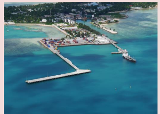
ベジオ港拡張：連絡橋、係留棧橋(キリバス)