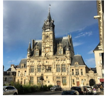
City hall of Compiègne