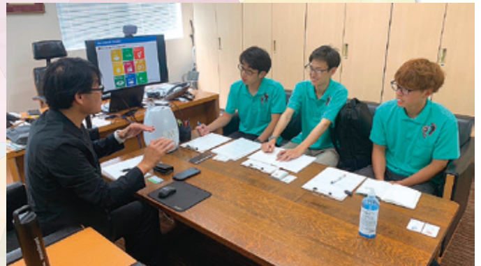
SDGsに取り組む地域企業取材し、リーフレットにまとめ、広く配布しています。