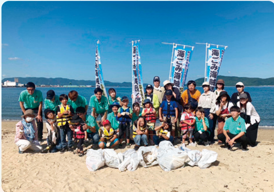
「僕たちは香川の海ごみ海賊団！」では、海ごみ拾いを通して自分たちの生活を見直すきっかけを作りました。