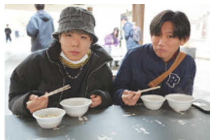
幸町キャンパスは休み明けの1月15日に実施され、温かい味を求めて行列ができました。

川の食文化に触れてもらい、県内出身の学生は家庭の味とは違った味を楽しむ機会となりました。