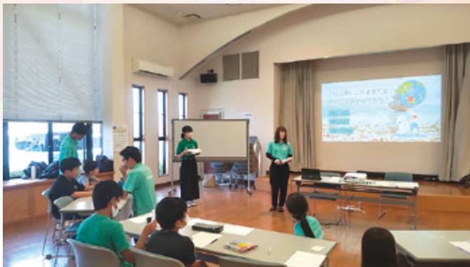
小学生向けに環境講座を実施し、SDGsや環境問題について一緒に考えました。