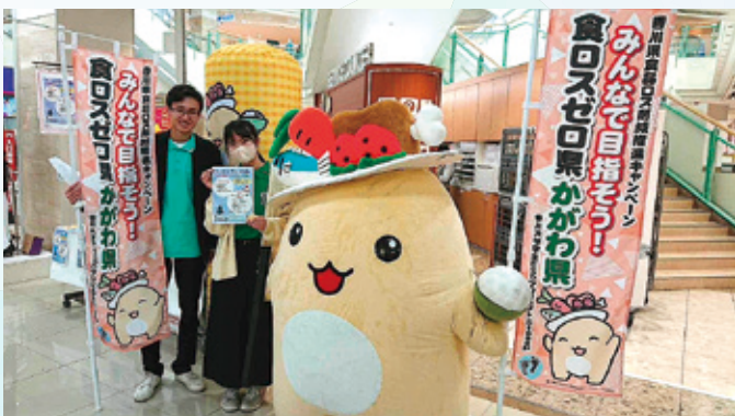
「みんなで目指そう！食ロスゼロ県かがわ県」では、スマート・フードライフ推進キャラクター「たるる」と啓発活動を行いました。