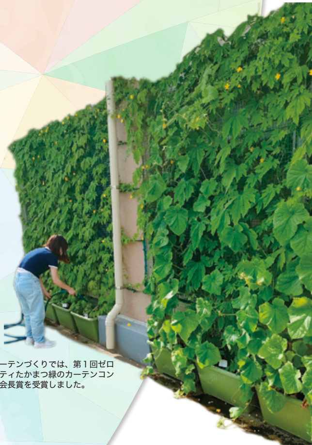
グリーンカーテンづくりでは、第1回ゼロカーボンシティたかまつ緑のカーテンコンテストにて会長賞を受賞しました。