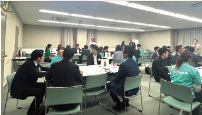
高松商工会議所青年部のみなさまと脱炭素をテーマにワークショップを行いました。