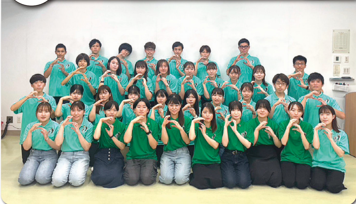
香川大学学生ESDプロジェクトSteepは、香川大学生約40名でSDGsや環境問題に取り組む学生団体です。

香川大学学生ESDプロジェクトSteepは、2017年に発足したSDGsや環境問題をテーマとする学生プロジェクトです。「香川から世界へ!エコな社会を目指して」を活動目標として掲げ、環境問題について考えるきっかけの場作りを目的として活動しています。私たちメンバー全員が香川県学生地球温暖化防止活動推進員に任命されており、子どもを対象とした環境教育や、香川県内の企業を対象としたSDGsに関する取材活動、食品ロス問題、海ごみ問題など、様々な課題に取り組んでいます。