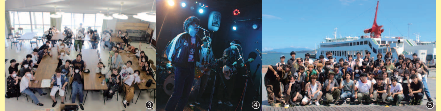
① ライブハウスでの集合写真 ② ライブハウスで熱唱している様子 ③ 夏合宿の様子 ④ ライブハウスで歌う部員たちの様子 ⑤ 夏合宿での1コマ高松港にて