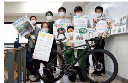
教室でのサークル紹介の様子

のサークルが日頃の練習の成果を披露しました。また、JASSOによる支援、香川大学生協の協力の下、新入生の新生活を応援するため、今年は新入生歓迎祭に合わせて、レトルト食品を無料配布し、お昼時にはうどんを振舞いました。新入生からも「うれしい！一人暮らしなので、助かる!」と言った喜びの声が多く聞かれました。