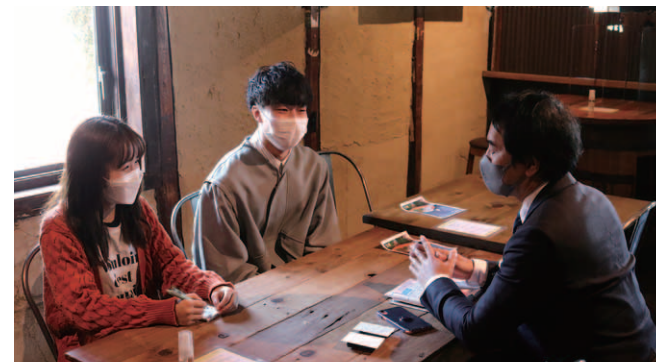
取材中の様子。メンバー全員で分担して取材交渉から記事制作まで行います。