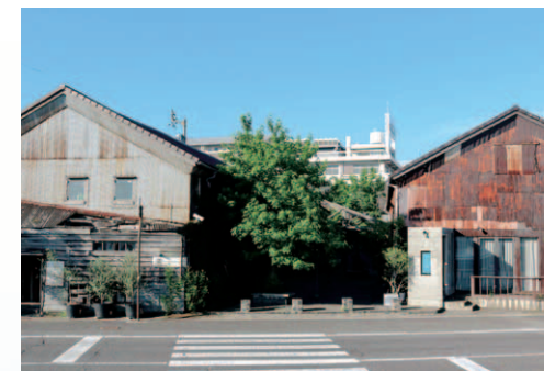
活動拠点である北浜地区の街並み。メンバーはみんな北浜の街並みが大好きです。