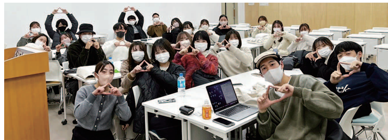
ミーティング中の様子です。和気あいあいと楽しく話し合っています。