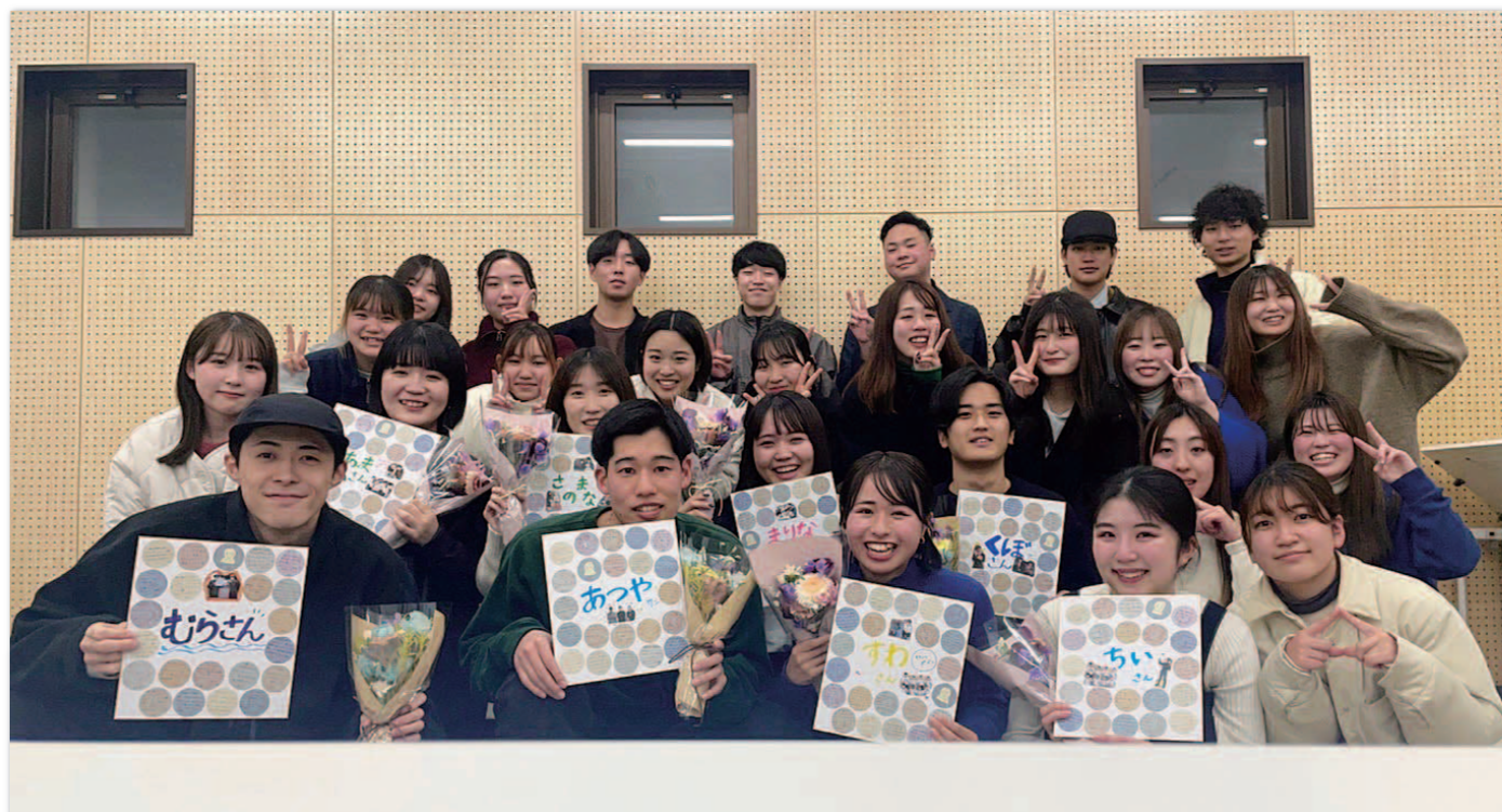
メンバーの集合写真。学年を超えてとても仲がいいです。

香川大学地域活性化プロジェクト Kitahama Labは高松市北浜地区の魅力発信、地域活性化を目指し、様々な活動を行っています。その活動のひとつとしてフリーペーパー link.の作成を行っています。Kitahama Labには写真やデザインに興味のあるメンバーが多数おり、コロナ禍でさまざまな活動が制限されたなかで、自分たちが地域のためにできることは何か模索していくうちに、自分たちのやりたいことと重ね合わせ、北浜地区の魅力を紹介するフリーペーパー制作を開始することに決めました。