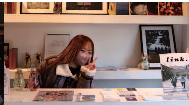
土日祝に私たちが運営している「きたはま案内所」にもフリーペーパーを置いています。