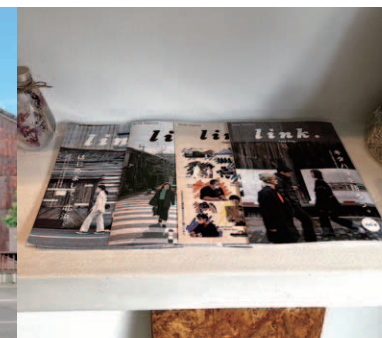
「きたはま案内所」には過去出版した4冊を展示しています。