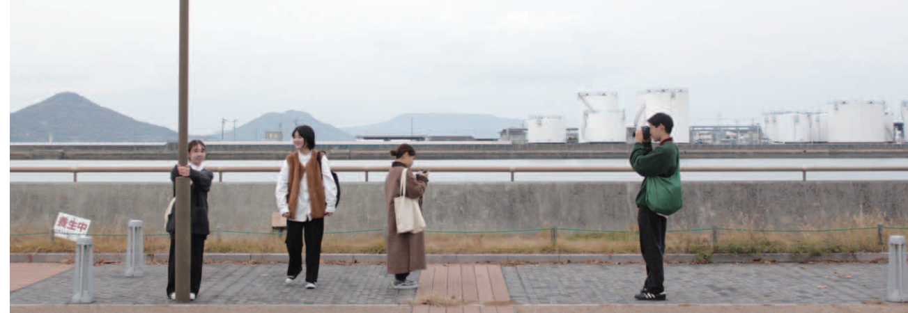
実際に紙面で使った写真です。紙面で使っている写真はほとんどメンバーが実際に撮影したものです。カメラの腕前もピカイチです！