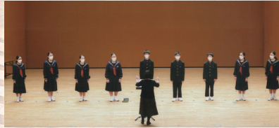
合唱 高松市立屋島中学校合唱部