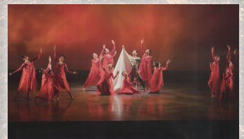
現代舞踊研究会「土曜族」