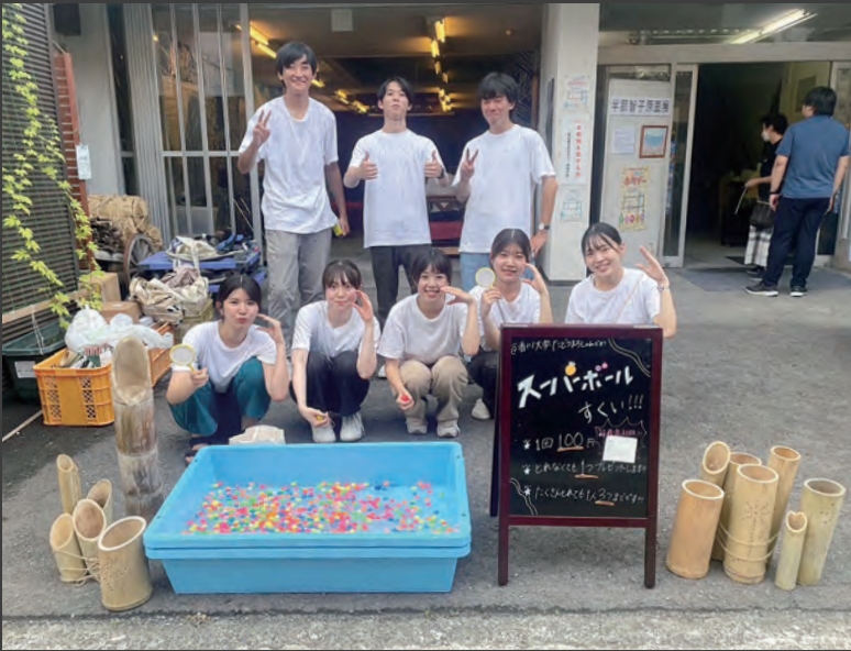
8月の本町デーの際の写真です。毎月メンバー自身とても楽しみながら活動を行っています。