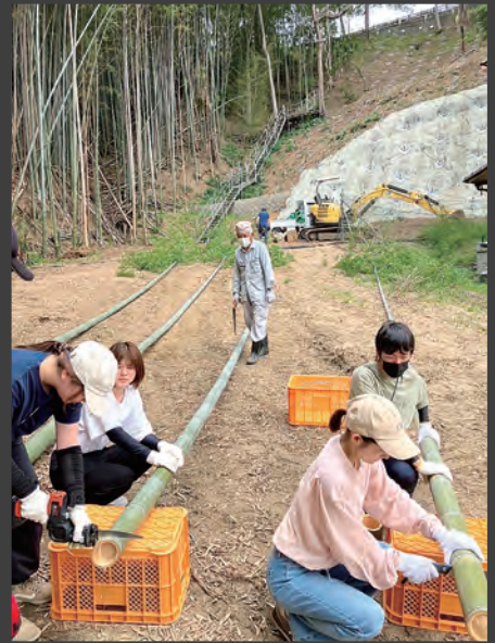
竹の伐採の様子です。多度津町の放置竹林から竹の伐採を行い、竹あかりを増産しています。