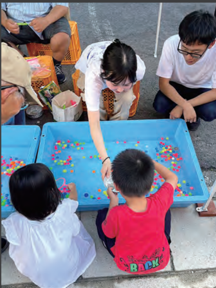
イベントでは、竹あかりの展示の他にも、スーパースポールすくいの出店をして、地域の方とコミュニケーションをとる機会をつくっています。