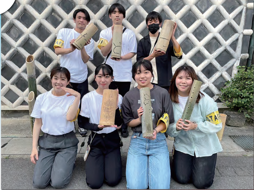
5月の本町デーの際の写真です。毎月楽しく活動を行っています。

私たちは、今年度より「重伝建指定を目指して歴史的町並みを照らす竹あかり」プロジェクトを実行しており、多度津町で実施されているイベント「第4土曜は！本町デー」にて毎月竹あかりの展示を行っています。多度津町は、重要伝統的建造物群保存地区に「多度津町本通」の地区が選定されることを目指しており、本イベントはその取り組みを後押しすることを目的としています。