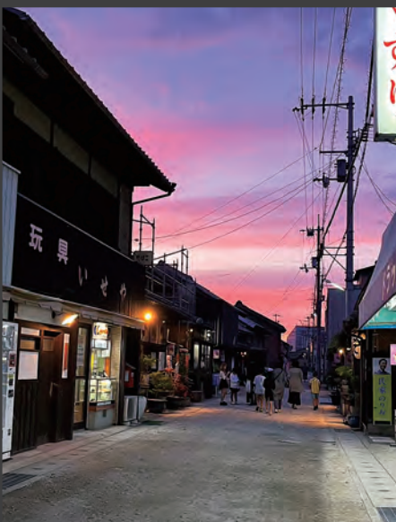
夕暮れ時の多度津町本通の様子です。レトロな雰囲気でも、どこか懐かしさを感じられる場所です。