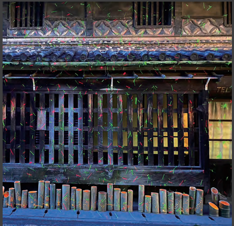
本町デーイベントでの竹あかりの展示の様子です。歴史的建造物と竹あかりがライトアップされてさらに魅力的に見えます！