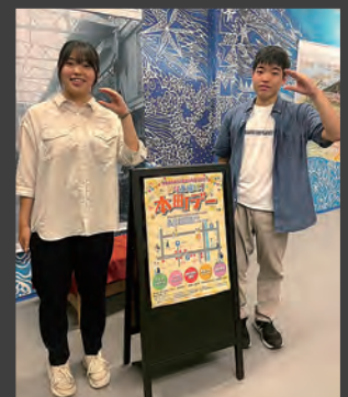
毎月行われる本町デーに向けたミーティングに参加した際の写真です。このミーティングでは、イベントの参加者が集まり、その月に何を出店するかなどの共有を行っています。