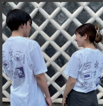
たどつまちLaboのオリジナルTシャツです！多度津町の特徴をたくさん詰め込んだデザインになっています。