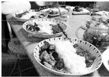
グリーンカレーとナムプリックオーン

着ることもできて、とても感動しました。みんなさんが私のことをかわいいと褒めたので、恥ずかしかったです。