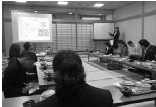
日本文化体験の様子