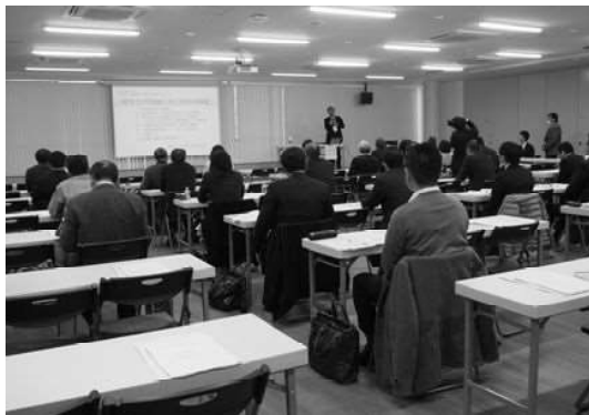
留学生採用支援セミナーの様子