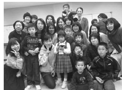
ヒッポのみなさん

最後に行った所は丸亀町です。車に乗っていた途中で瀬戸内海大橋を初めて見ました。ちゃんと見えなかったですけど、きれいだと思います。丸亀町行ったのはヒッポという外国語を勉強するクラブに参加するためです。ヒッポでは大人も子供もたくさん参加しています。みなさんは私と優しく話しかけて、色々な活動をしました。タイ語を教えたり、タイ語バージョンの恋するフォーチュンクッキーを歌ったり踊ったりしました。みなさんと出会って、とても嬉しかったです。みなさん優しくて、タイ語も少し話せますので、私はとても感動しました。また機会があったら、みなさんと会いたいです。今回のホームビジットは初めてで、色々ないい思い出があって、坂本さんの家族とヒッポのみなさんがありがたいです。