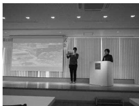
ホームビジット報告会の様子