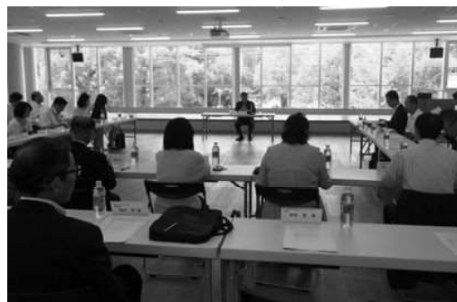
平成29年開催の様子