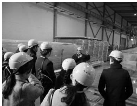
H27年度日プラ株式会社見学の様子