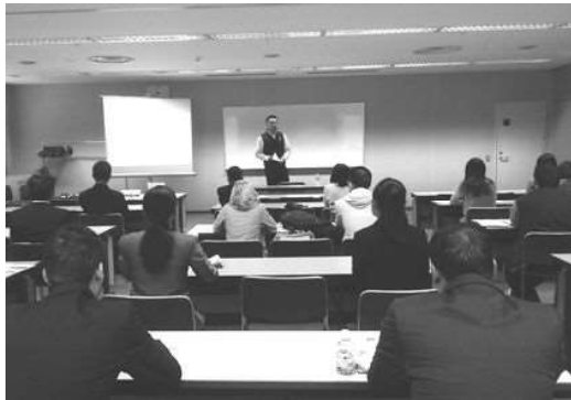
就活準備セミナー 先輩による講演の様子