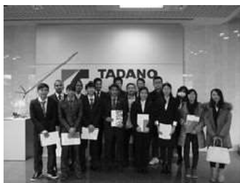
H28年度(株)タダノ見学の様子

平成22年度より毎年1月に開催され、県内の留学生等採用実績がある、もしくは今後の採用予定がある企業を訪問し、日本企業に対する理解を深め、就職後の自らのワークスタイルを考える契機として、就職活動のための知識を習得させる。