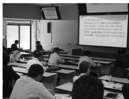
行政書士による講演の様子