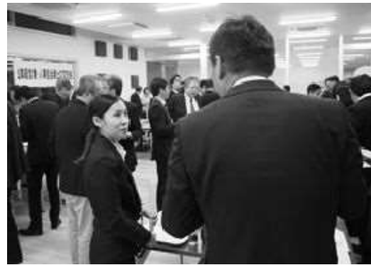
企業経営者及び人事担当者と留学生の交流会の様子