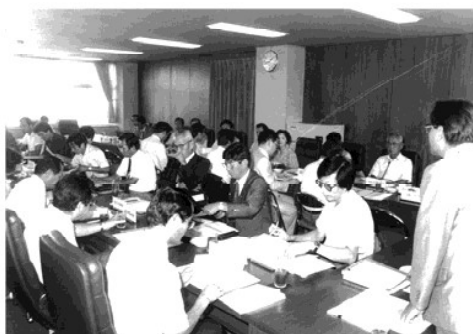
昭和62年開催の様子

毎年6月中下旬に開催し、前年度実施事業報告及び決算、当該年度実施事業計画及び予算について審議を行う。総会に諮るにあたり、5月に運営委員会及び就職支援部会を開催し、事前審議を行っている。