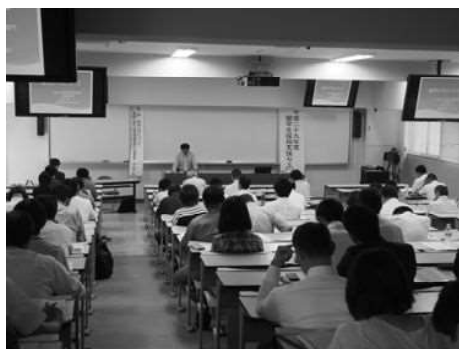
入国管理局首席審査官による講演の様子

毎年8月上旬に高松入国管理局から審査官や行政書士をお招きし、講演を実施している。平成25年度からは、就職支援事業として参加対象を企業人事担当者にも拡大している。