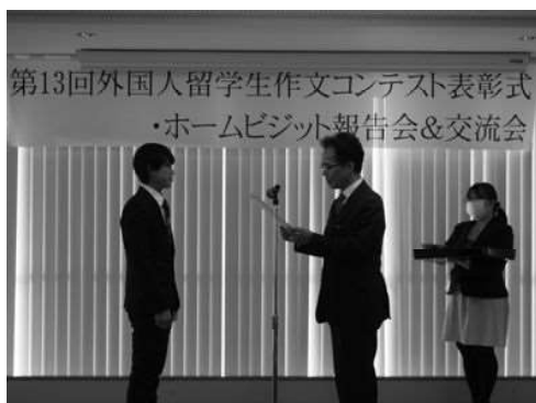
第13回作文コンテスト表彰式の様子

表彰式開催にあわせ、ホームビジットの報告会や留学生所属校による活動報告会、交流会などを実施することもある。