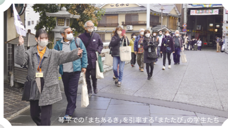
写真での「まちあるき」を引率する「またたび」の学生たち