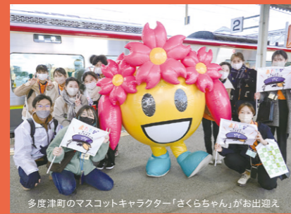
多度津町のマスコットキャラクター「さくらちゃん」がお出迎え