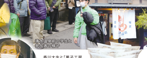
清水温泉前の学生と参加者の様子