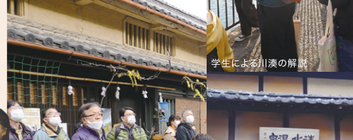
学生による川湊の解説