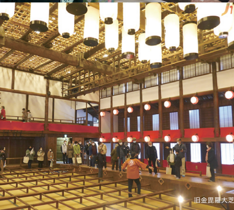
旧金毘羅大芝居(金丸座)