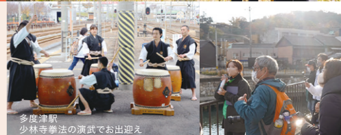
多度津駅 少林寺拳法の演武でお出迎え