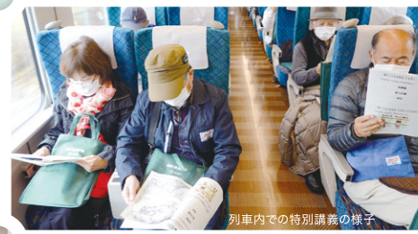
列車内での特別講義の様子