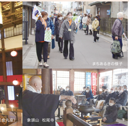
まちあるきの様子