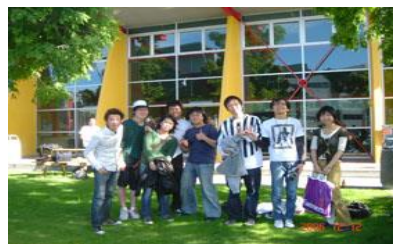
現地での長期と短期学生の記念写真