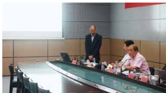
ロンインターナショナル副オフィス長による大学紹介