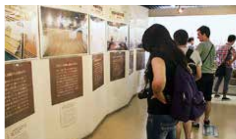
醤油造りの過程の展示

午前中には日本三大渓谷美の一つである寒霞渓で日本の自然を、午後からはマルキン醤油記念館にて日本の味の素となる醤油造りの歴史や製造方法などを学びました。特に有形登録文化財に指定