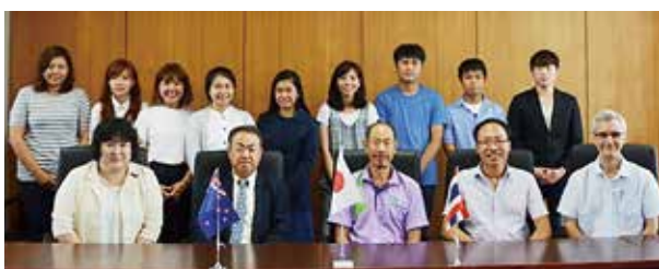
チェンマイ大学学生

6月9日(木)、チェンマイ大学(タイ)の学生8名及び教員1名とクライストチャーチ・ポリテクニク工科大学(ニュージーランド)の学生1名が、筧インターナショナルオフィス長を表敬訪問しました。