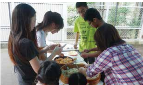
花園寮での寿司づくり

交流会当日は天気にも恵まれ、寮生らは、そうめん流しの竹を設置したり、稲荷ずしを作ったりして、地域の方々をお迎えする準備に励みました。準備が整ったところで寮生代表が地域の方々をご案内し、花園町自治会長様を始めとする地域の方々にご参加いただき、和やかな雰囲気での交流しました。