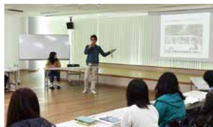
学生による帰国報告