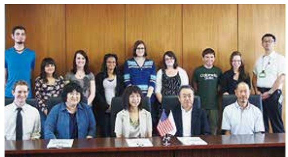
コロラド州立大学学生

本学とコロラド州立大学は国際交流協定を締結しており、本学の教育学部を中心に交流が盛んです。今回訪問した学生は、6月1日から7月3日までの5週間、本学教育学部の「アジア・アメリカ異文化交流短期受入プログラム2015」に参加し、ホームステイや、地域コミュニティとの交流などを通じて、日本の文化への理解を深めました。