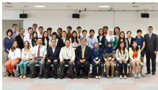
プログラムの参加者