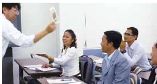
本学教育学部附属教職支援開発センターで講義受講