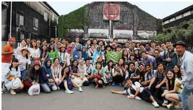
マルキン醤油記念館での集合写真