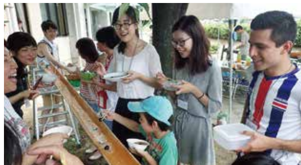
留学生会館の様子