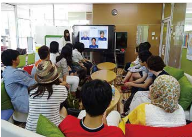
「なでしこジャパン」についてプレゼンテーションする日本人学生

2つ目は、TOEIC SWを受験したい学生のため、ビジネス単語を練習したり、英語を話す能力や書く能力を伸ばしたりする授業「TOEIC SW」です。受講生は、本授業を受けた後に実際にTOEIC SW試験を受けます。