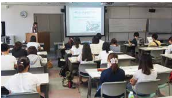
危機管理セミナーの様子