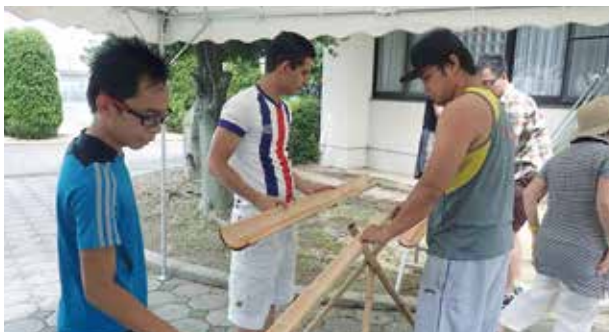
留学生会館での竹組み立て