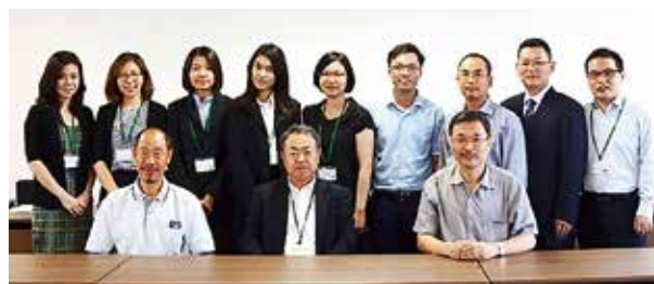
さくらサイエンスプラン参加者

7月14日(火)、アジアと日本の青少年が科学技術の分野で交流を深めることを目的とした独立行政法人科学技術振興機構の「日本・アジア青少年サイエンス交流事業(さくらサイエンスプラン)」に本学が採択され、招へいされた外国人研究者等9名が、寛インターナショナルオフィス長を表敬訪問しました。