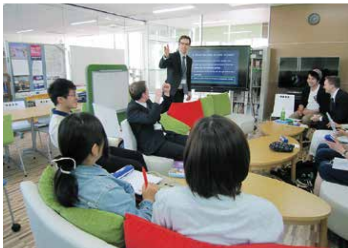
English Roundtable の授業風景

3つ目は、英語の文法や発音を向上させるための授業「English Studio」です。この授業では決まったテキストは使わずに自由な形式で英語の練習をします。受講生はさらに、任意で英作文も提出し、非常勤教員による添削を通じて、英作文能力も上達させています。