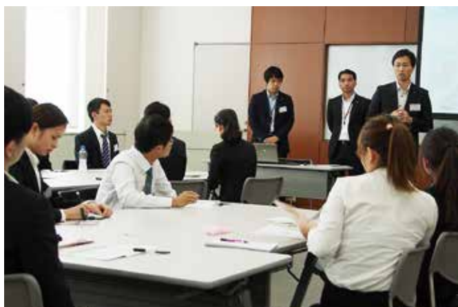
資料を見ながらお話を伺う学生たち