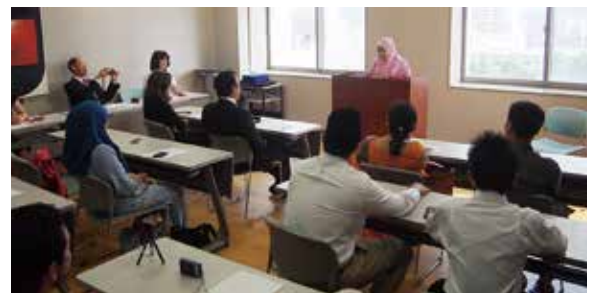
修了生によるスピーチの様子