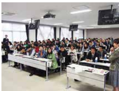
ガイダンスの様子

当日は、高松北警察署から講師をお招きし、生活様式や交通ルールの違いから起こりやすい事件・事故を未然に防止するための「法令遵守ガイダンス」も行いました。講師からは、生活安全関係では加害者や被害者にならないために、麻薬や万引き・ひったくり等の身近な犯罪行為について、交通関係では留学生の多くが利用する自転車のルールや罰則について映像を交えたり、実物の自転車を使ったりする説明がありました。