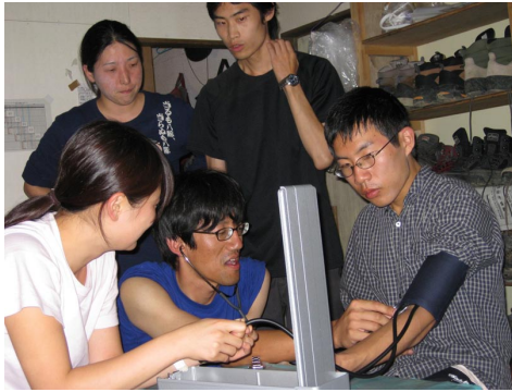
※写真注釈・・・現役看護師さんから水銀式血圧計の使い方教えて頂く学生たち