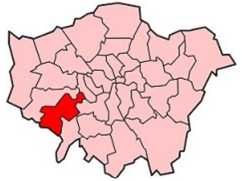
【写真1:リッチモンドの位置】