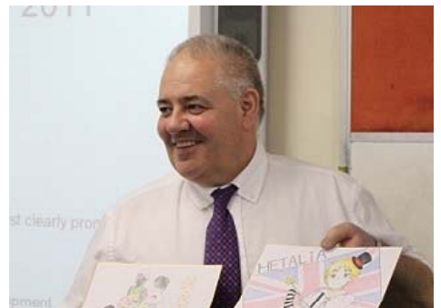
【写真2:ジャーマン校長】