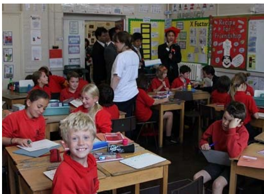
【写真3:通常の授業風景】