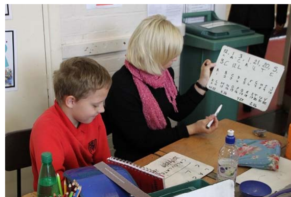
【写真4:補充学習の様子】