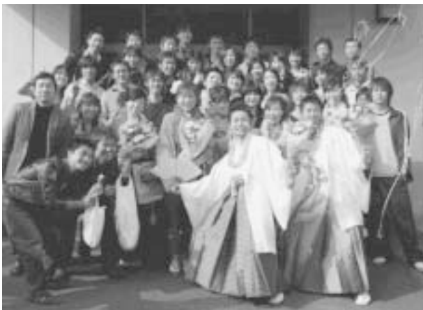
卒業式での1シーン