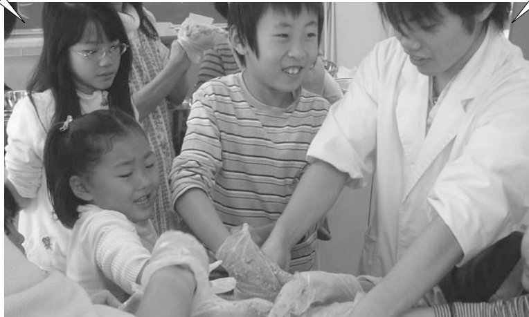
▲ソーセージ作りを体験