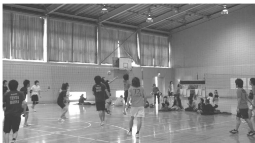
▲スポーツ大会(バレーボール)