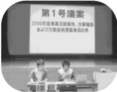
理事会より議案の提案・説明

■2007年5月24日(木)、第66回通常総代会が、大学会館第1集会室で開催され、全ての議案が賛成多数で可決、2007年度新役員が選出されました。