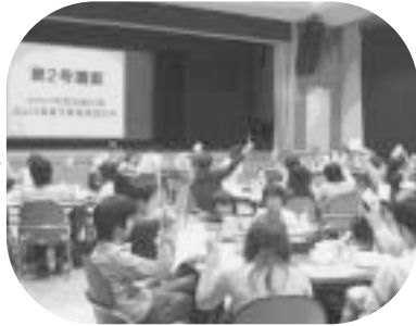
各階層から選出された総代が議決