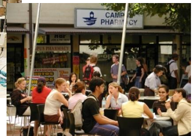
キャンパスの風景