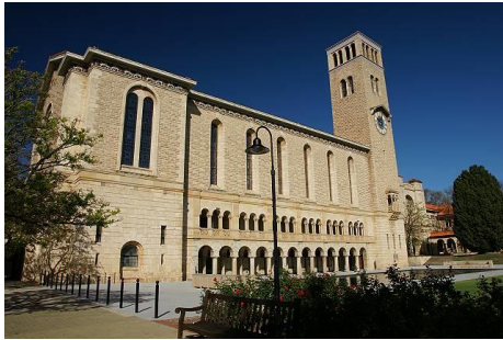
西オーストラリア大学の象徴ウインスロップ・ホール (1932年築)