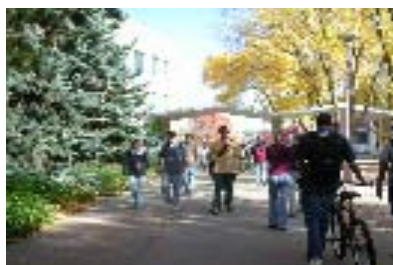
授業の合間に移動する学生(左は図書館)

コロラド州立大学の科学数学工学センター(CSMATE)との共同研究でインターネットを活用した香川県下の教員研修事業、物理学科との共同研究で日米同時配信特別講義、CSU日本語学科教員及び学生と、教育学部附属学園との授業実施並びに交流活動など様々な交流活動が活発になされている。