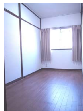
Room1 (store room)