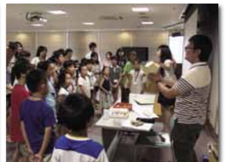
第17回ミュージアム・レクチャー「星座の物語～プラネタリウムを作ろう!～」