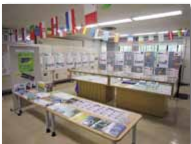
日・EUフレンドシップウィーク 「イタリア展」