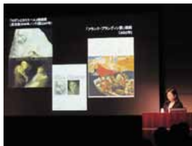
EU公開講演会 「EUデジタル美術展・図書館の楽しみ方」