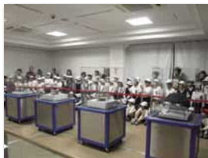
第8回企画展「小惑星探査機『はやぶさ』帰還カプセル展」での亀阜小学校団体見学