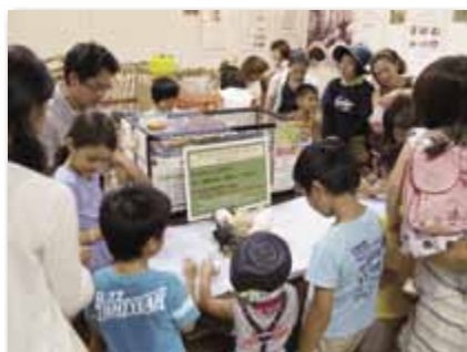
第7回企画展「おいしいお肉のむこうには…」でのふれあいコーナー