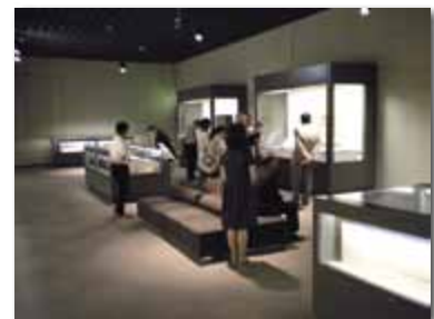
平成23年度神原文庫資料展 「知の体系ー江戸時代にやってきた自然科学ー」

沿革 香川大学憲章 組織図 役員 役員数 学部・研究科 学生の定員及び現員 前年度定員の増減状況 入学状況 卒業生就職状況等 日本学生支援機構奨学金学生数 施設等 公開講座 国際交流 財務状況 産学官連携 医学部附属病院 機構等 キャンパス