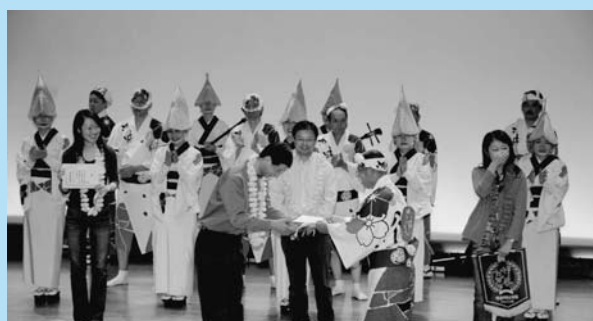
阿波踊り会館にて