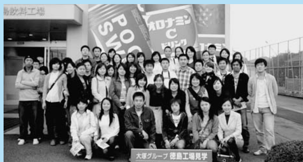
大塚グループ徳島工場にて