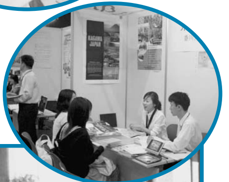
日本留学フェア (韓国にて)