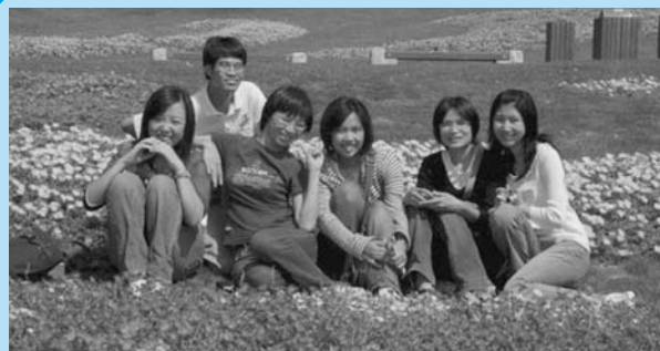
国営明石海峡公園にて

今回の課外学習を通じて、日本のすばらしい自然に触れることができ、更に、日本の文化や自然災害について勉強することができて、とても充実した時間を過ごしました。最後に、このようなすばらしい旅を企画して下さいました留学生支援グループの先生方に留学生を代表して感謝し、お礼を申し上げます。