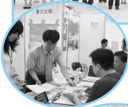
日本留学フェア (台湾にて)