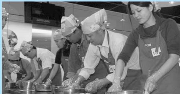
インスタントラーメン発明記念館にて