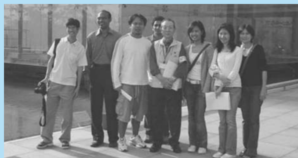
人と防災未来センターにて、ボランティアガイドと共に（神戸）