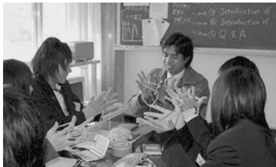
Roxas, Rodrigo Faustino (フィリピン)