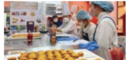
※掲載写真は全てイメージです