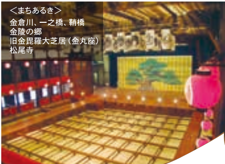
旧金毘羅大芝居(金丸座)

<まちあるき> 金倉川、一之橋、鞆橋 金陵の郷 旧金毘羅大芝居(金丸座) 松尾寺