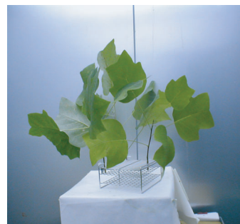
ユリノキを用いた生合成研究

リグナンは針葉樹・広葉樹心材に多量に存在する化合物です。高等植物に一般に広く分布しています。光学活性を示し、生理活性物質として医薬の分野で注目されているものもあります。そうしたリグナンの生合成・抗菌作用・抗酸化作用及びヒトに対する薬理活性について研究しています。