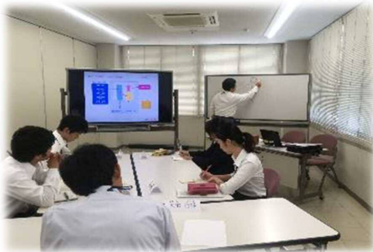
「富士ゼロックスの社員として」

Fuji Xerox Internal Use Only 富士ゼロックス株式会社 〒100-0001 東京都千代田区千代田 1-3-3 電話 03-5561-1111