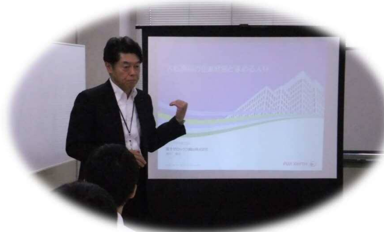
経営者ご挨拶(2日目)