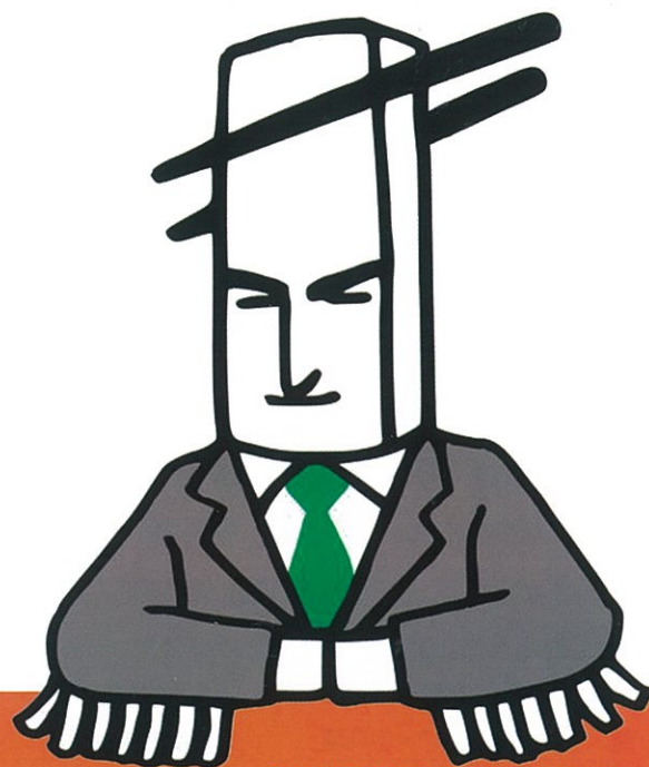
うどん県観光課係長「うどん健」